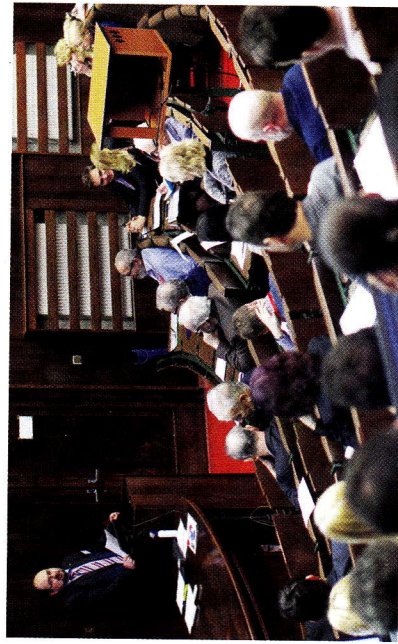
I. celonárodní lékárenský sněm v Brně byl první akcí spolku Vaši Lékárníci CZ s velkou účastí

Následně jsme se několik měsíců aktivně podíleli na schůzkách na ministerstvu zdravotnictví, připravovali jsme podklady pro státní správu a samosprávu, připravili také nejeden odborný materiál pro poslance a senátory. Aktivně jsme se účastnili, jako pozvaní experti z praxe, i jednání parlamentního podvýboru pro eHealth a připomínkovali fungování e-receptu. Zároveň se podařila celá řada mediálních výstupů, které dokreslily závažný aktuální stav lékárenství v České republice. Je důležité vzpomenout i velkou aktivitu našeho spolku na sociálních sítích, kdy pojišťovny ještě při druhém kole Dohodovacího řízení naprosto ignorovaly dosažené dohody s ministrem Adamem Vojtěchem. Náš diskuzní tlak přes Twitter, vnesl do jednání novou dimenzi a pomohl dosáhnout dalšího posunu. V tuto chvíli již mnoho našich zákonodárců disponuje vysvětlující dokumentací, kde jsou definovány naše priority v oblasti reformem lékárenství. Díky právním analýzám a znalosti se již prakticky nemůže stát to, že přístup některých úřadů bude k naší problematice netransparentní, neboť většina materiálů je aktivně sdílena i novinářům a reportérům, kteří provádějí demokratickou kontrolu nezávislého tisku a informačních médií. Toto je znát zejména v posledních dnech, kdy se relativně velmi jednoduché novely Zákona o léčivech schovávají za hledání neuvěřitel-